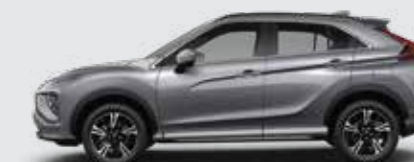
▶ GRIS OSCURO