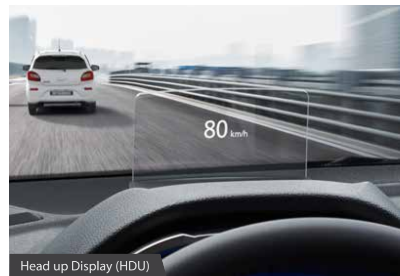
Head up Display (HDU)