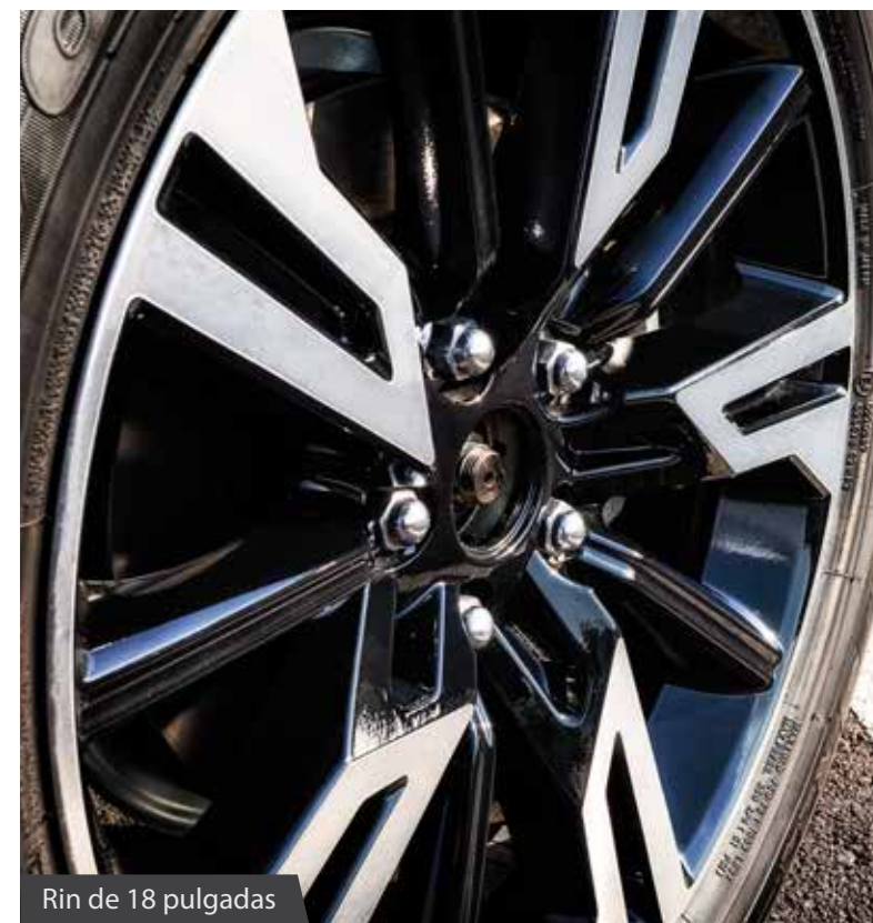
Rin de 18 pulgadas

Las versiones de tracción delantera disponen del sistema AYC que mejora las prestaciones en curva mediante el frenado óptimo e independiente de las ruedas delanteras. En el display central del cuadro de instrumentos se muestra el funcionamiento del sistema.