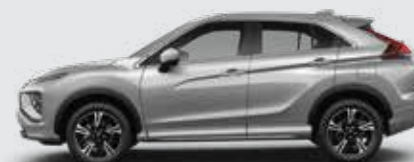
▶ GRIS CLARO