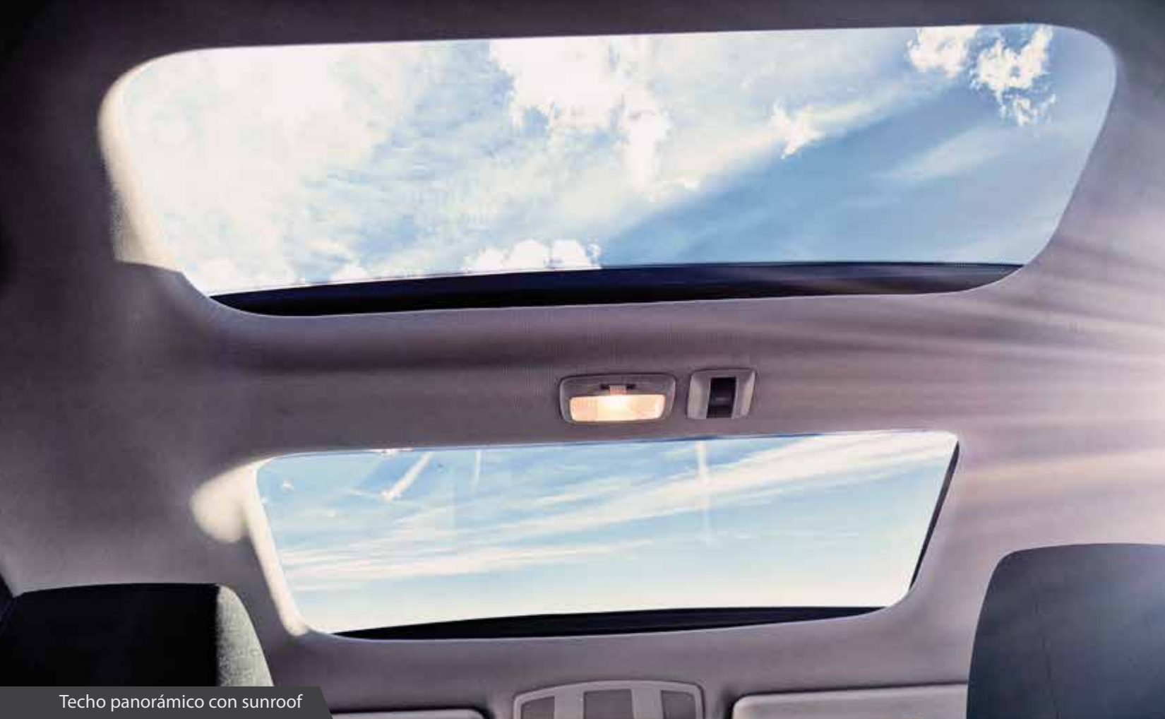
Techo panorámico con sunroof