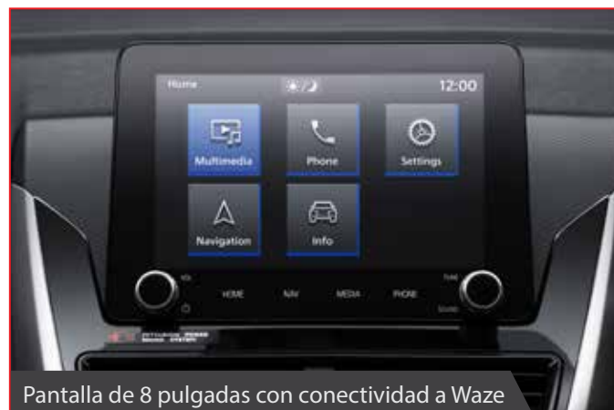
Pantalla de 8 pulgadas con conectividad a Waze