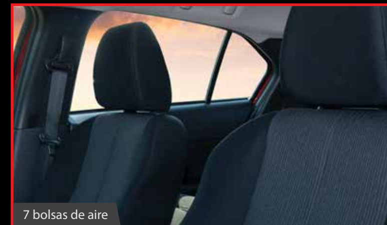
7 bolsas de aire