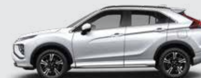
▶ BLANCO PERLA