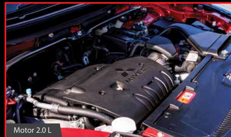
Motor 2.0 L