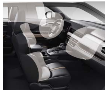
Seis bolsas de aire.