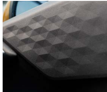
Textura adiamantada en puertas.