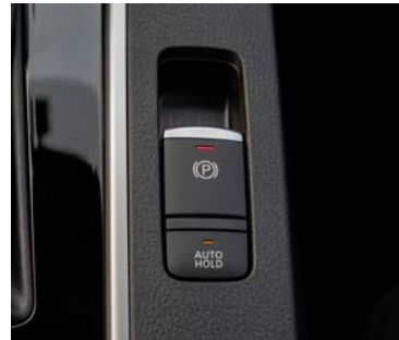
Freno de mano electrónico con AUTOHOLD.