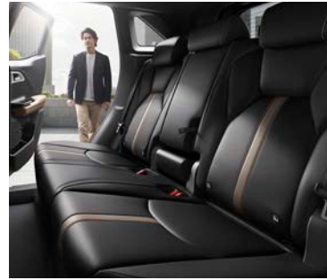
Asientos cuero doble tono.