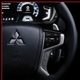
Timón forrado de cuero y paletas de cambio al volante