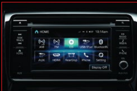
Pantalla De 8" con conectividad a Waze