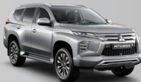
GRIS CLARO (U25)