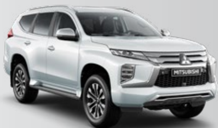
BLANCO PERLA (W85)