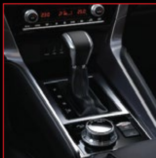
Transmisión automática de 8 velocidades