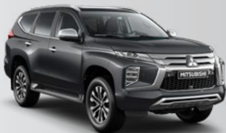
GRIS OSCURO (U28)