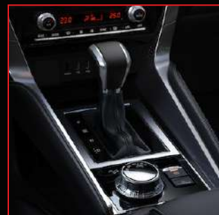
Transmisión automática de 8 velocidades