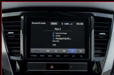
Pantalla De 8" con conectividad a Waze