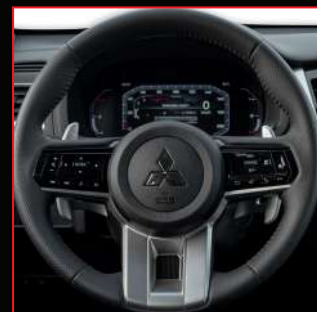
Timón forrado de cuero y paletas de cambio al volante