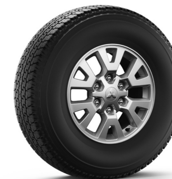
Llanta: aleación de 16 pulg. 265/70R16 todo terreno