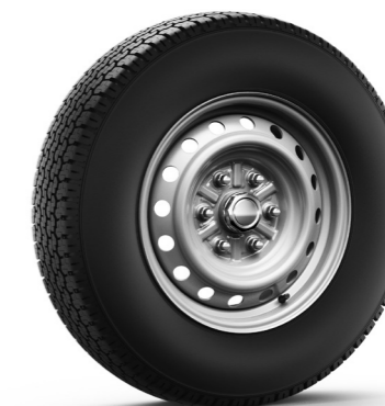
Llanta: acero de 16 pulg. 205/R16C 8PR