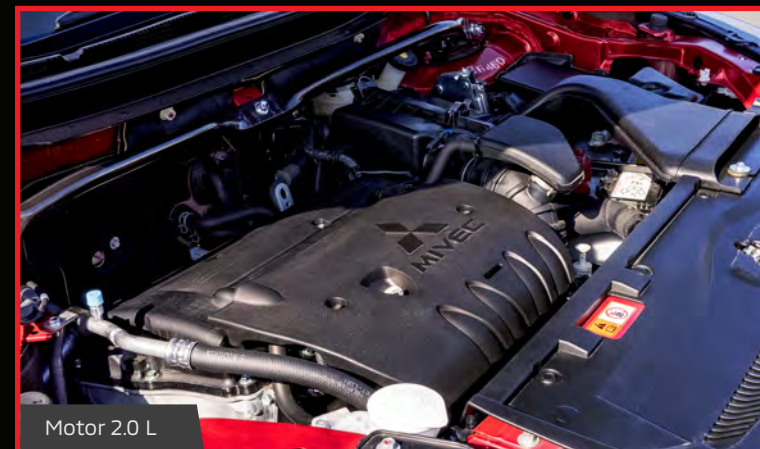
Motor 2.0 L