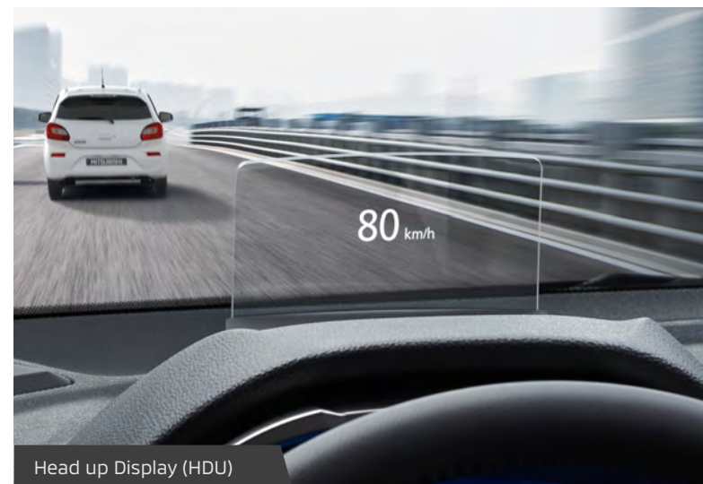
Head up Display (HDU)