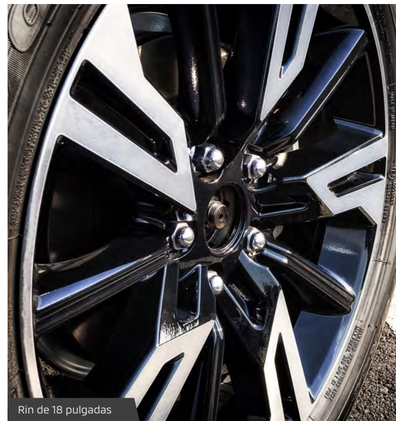
Rin de 18 pulgadas

Las versiones de tracción delantera disponen del sistema AYC que mejora las presentaciones en curva mediante el frenado óptimo e independiente de las ruedas delanteras. En el display central del cuadro de instrumentos se muestra el funcionamiento del sistema.