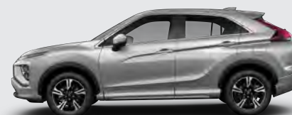
▶ GRIS CLARO