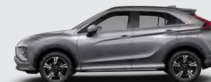
▶ GRIS OSCURO