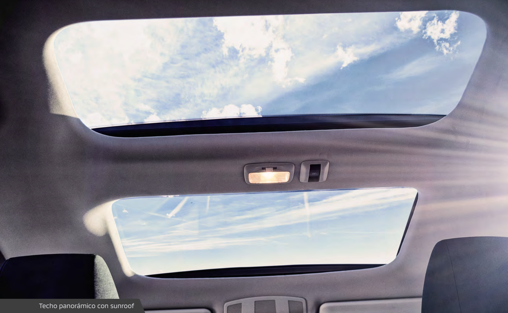
Techo panorámico con sunroof