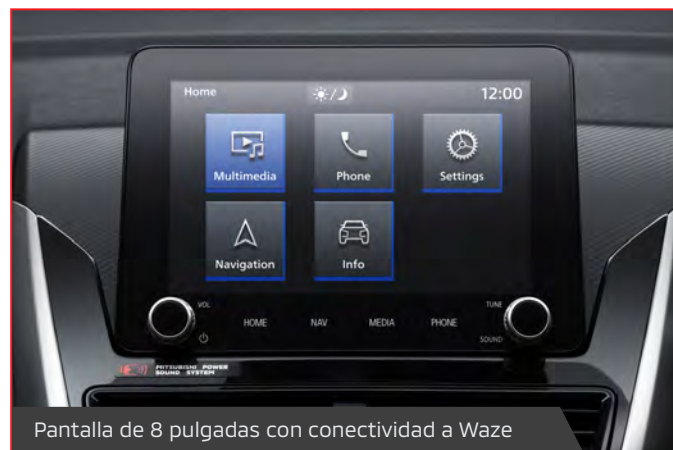
Pantalla de 8 pulgadas con conectividad a Waze