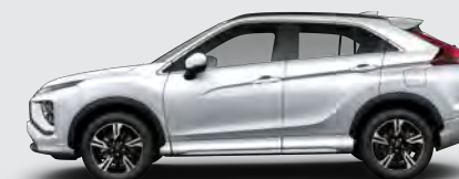
▶ BLANCO PERLA