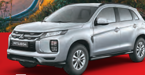
PLATA METALIZADO U25