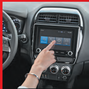
Pantalla de 8" Mitsubishi Smartphone link display audio (SDA)