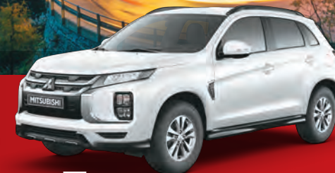
BLANCO PERLA W13