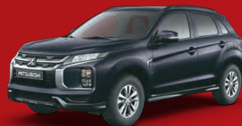
NEGRO MICA X 42