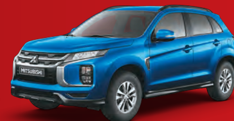
AZUL DEPORTIVO D06