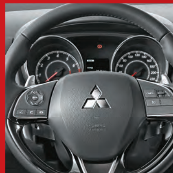
Control crucero y paletas de cambio