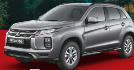
GRIS TITANIO U17