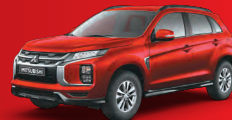
ROJO DIAMANTE P62