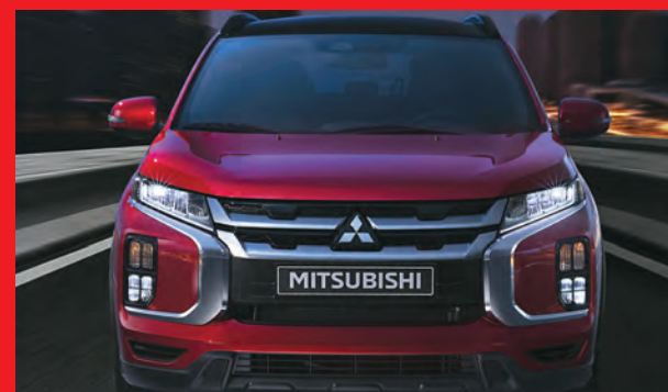
Renovado, potente y robusto diseño en las partes delanteras y traseras